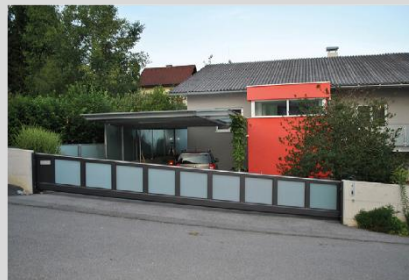
BALU Glasfüllung Barcelona