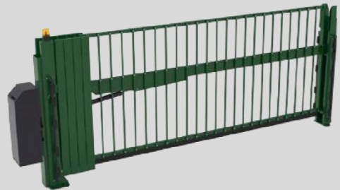
2 Avantgates 1.x R V50-XL