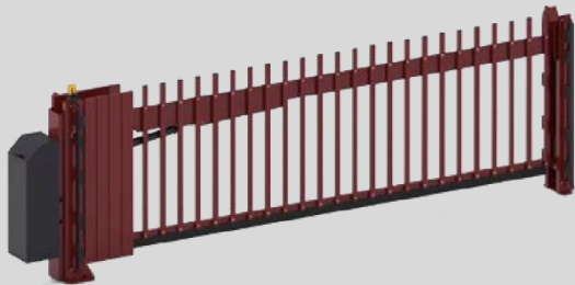
1 Avantgates 1.x R V50-STD